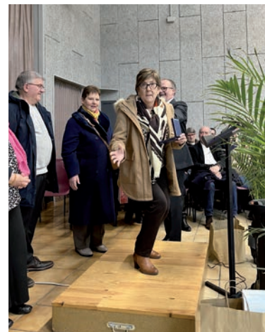
Ci-dessus, le bureau directeur du Comité Sports et Loisirs de Villemer mis à l'honneur.