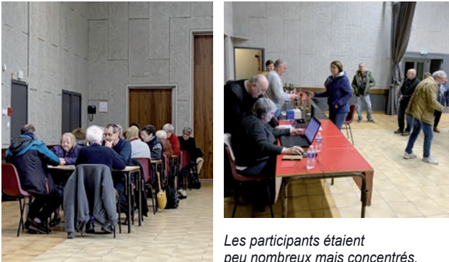
Les participants étaient peu nombreux mais concentrés.