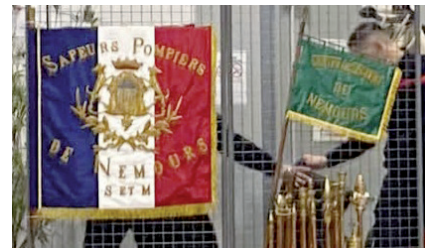
Ci-contre, Le drapeau restauré du centre de secours de Nemours.