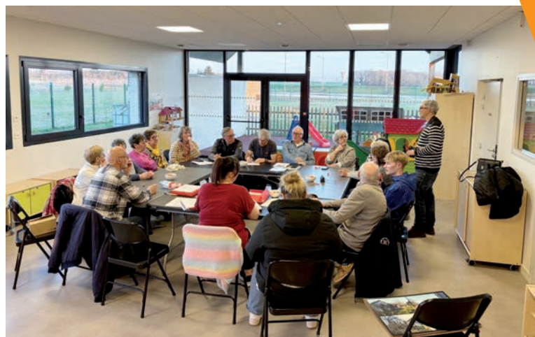
Lors de la réunion du 18 mars, des Villemerois définissent les sujets à partager sur la commune.

N'hésitez pas à contacter l'Espace Des Habitants au 01 64 32 81 83